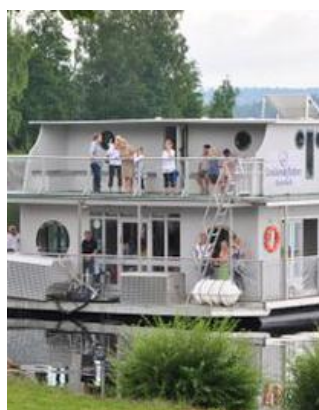
En unik heldag på konferensbåt på småländska Rusken

Boka redan nu – först till kvarn gäller! Deltagare är begränsat till max 12 personer. Anmälningsblankett finns på särskilt dokument.